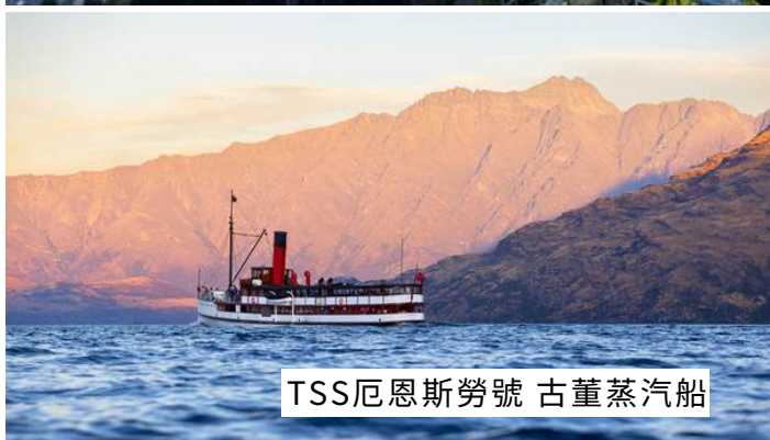
TSS厄恩斯勞號 古董蒸汽船