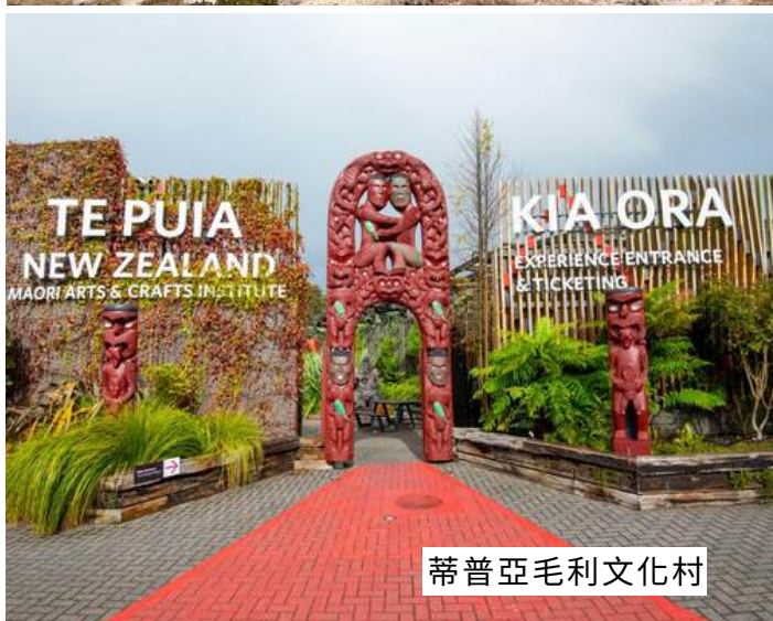
蒂普亞毛利文化村