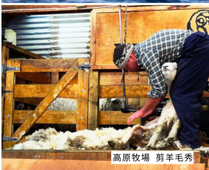
高原牧場 剪羊毛秀