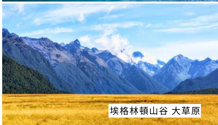
埃格林頓山谷 大草原

皇后鎮，連泊2晚才是王道！皇后鎮堪稱南島最活躍的景點，在南阿爾卑斯山脈與瓦卡蒂波湖加持下，得天獨厚的美景與名聞遐邇的戶外活動天堂。在這麼好玩的皇后鎮當然要連泊2晚，從容享受南島輕快瘋狂的大自然旋律！